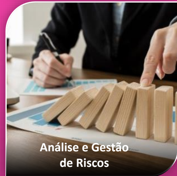
Análise e Gestão de Riscos