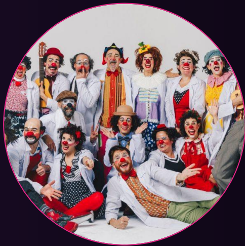
Doutores da Alegria