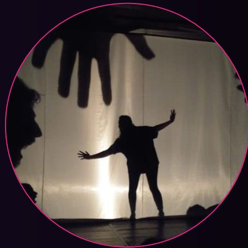
Teatro de Sombras