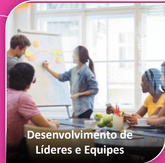
Desenvolvimento de Líderes e Equipes