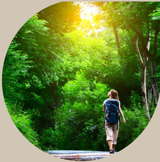
Conexão com a natureza