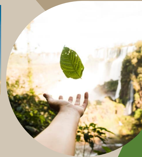
Experienciar para transformar