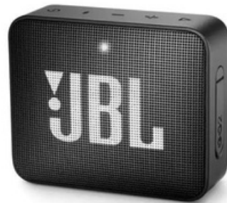
CAIXA DE SOM JBL WIRELESS BLUETOOTH SPEAKER