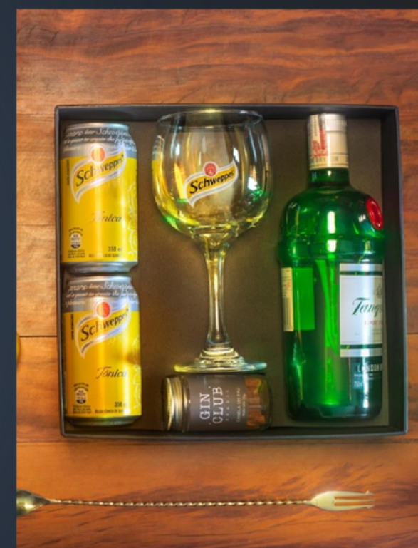
Kit Drink do Papai