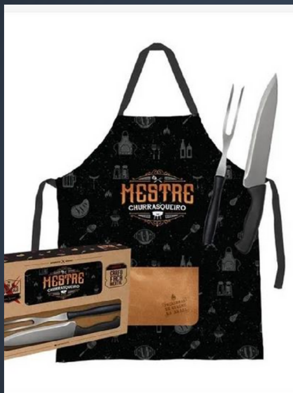
Kit Churrasco do Dady