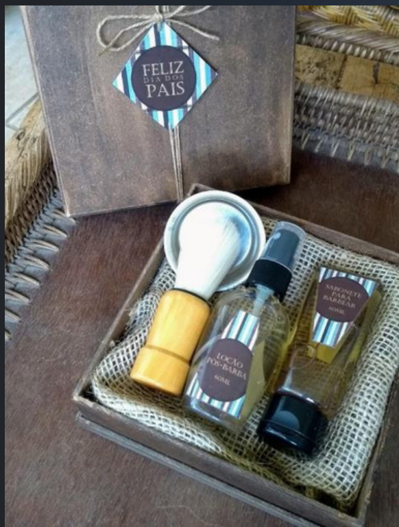
Kit Beleza e Bem Estar