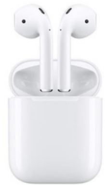
FONE DE OUVIDO AIRPODS