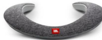
CAIXA DE SOM JBL SOUNDGEAR