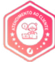
Workshop de Atendimento ao Cliente