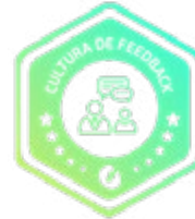
Workshop Cultura de Feedback