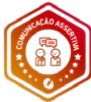
Workshop Comunicação Assertiva