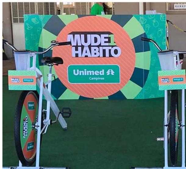
Painel Personalizado Cliente