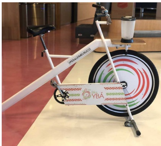
Bike Ybá Padrão