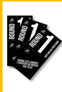
Votação por Ficha de voto