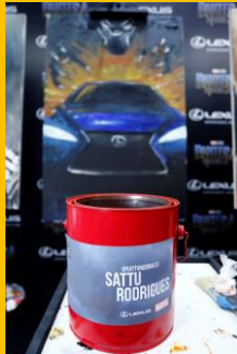
Identificação na urna de voto