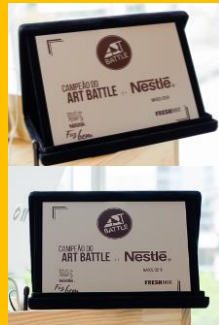
Troféu com logo do cliente