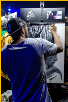
Identificação no cavalete