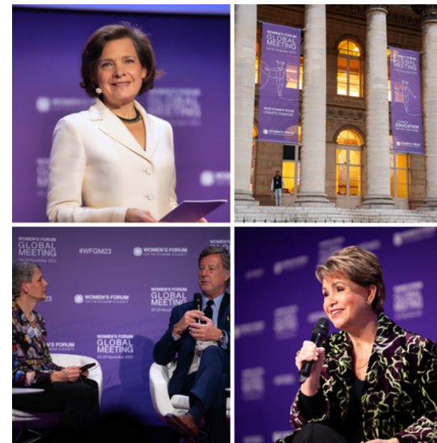
WOMEN'S FORUM GLOBAL MEETING