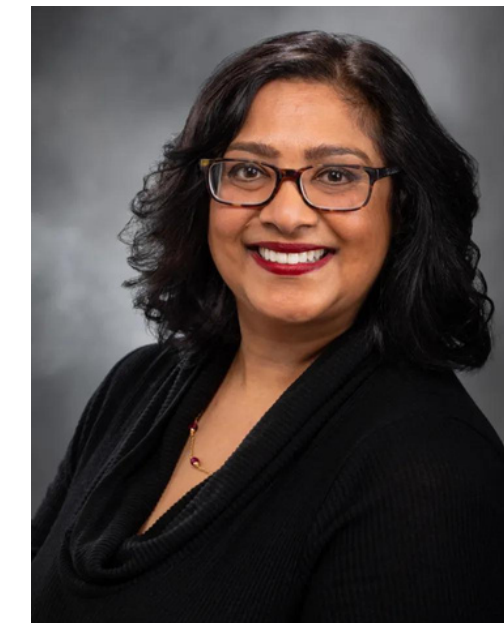
MONA DAS SENADORA WASHINGTON DC