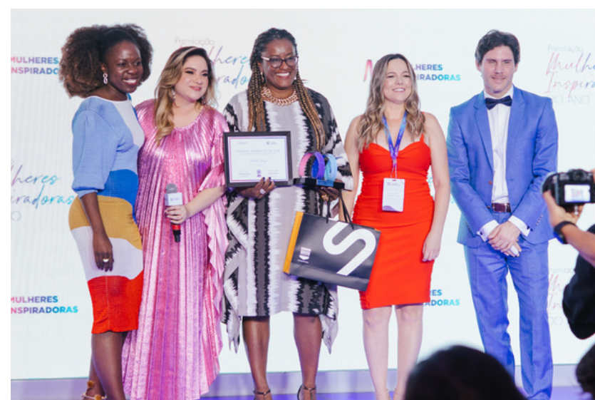
Jandaraci Araújo Conselheiras 101