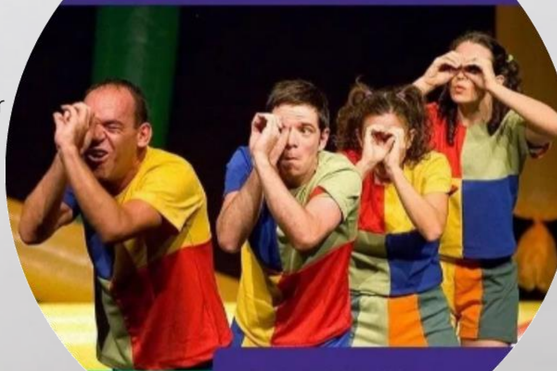
BRINCOS E FOLIAS

Balangandança Cia., desde 1997 une arte e educação para discutir a linguagem corporal da criança com trabalhos originais, contando com diversos espetáculos e centenas de apresentações em todo o Brasil