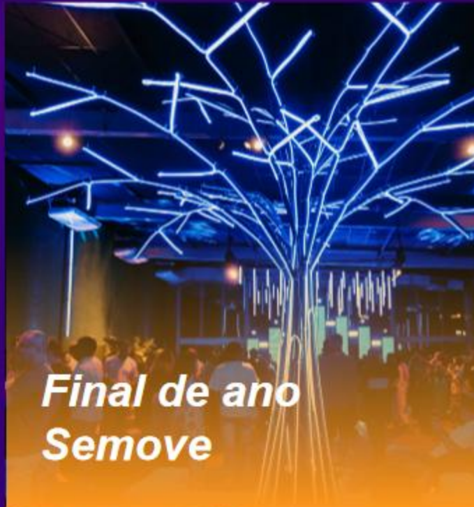
Final de ano Semove