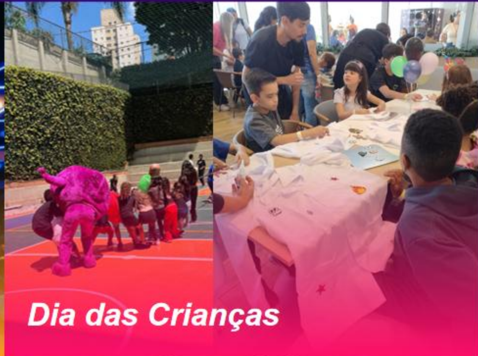
Dia das Crianças