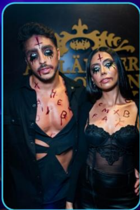
Concurso de fantasias