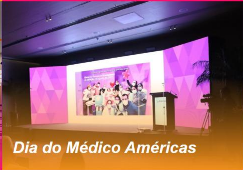
Dia do Médico Américas